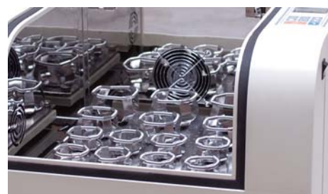
[03] Visualización de las muestras desde el exterior. Visualization of the samples from the outside.