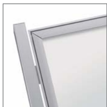
A - B