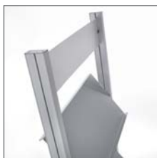
C - D